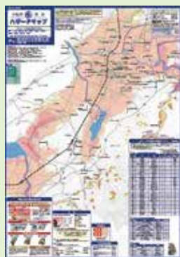
洪水ハザードマップ