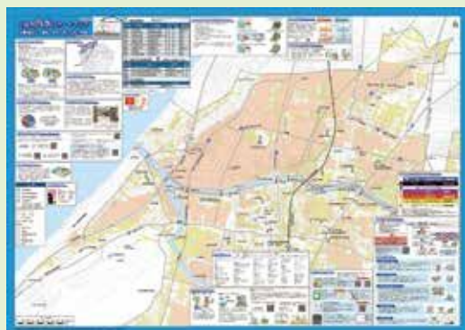
NEW 内水ハザードマップ