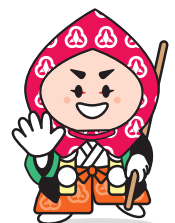
小松市イメージキャラクター カブッキー

平成25年7月29日は市の観測史上、過去最高雨量を記録し、市民一丸となって重大な被害を回避できた日。これからも災害に対する心構えや、防災意識の啓発を行っていきます。 7月29日は「市民防災の日」