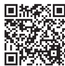
各種ハザードマップ