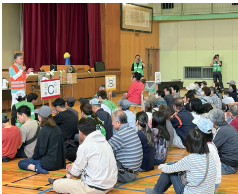
稚松校下防災訓練

5月18日(日)丸内中学校にて稚松校下防災訓練が実施されました。稚松校下町内会連合会、第1稚松分団、稚松防災士の会が連携し、放水訓練や応急手当訓練などの災害を想定した訓練や災害食づくり、新聞紙で作る食器づくりなどの体験、プライベートテントや簡易トイレといった防災グッズの展示など様々な形で防災について学び、考えることができる良い訓練となりました。