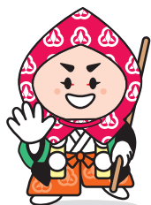
小松市イメージキャラクター カブッキー