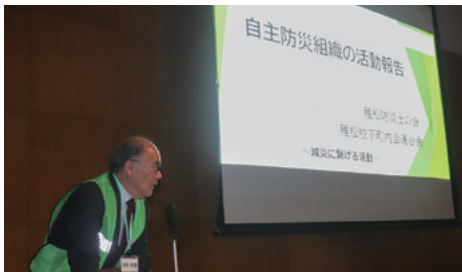
稚松自主防災組織 活動報告