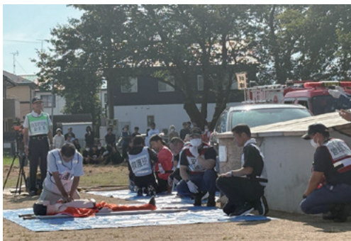
串校下自主防災会 応急救護訓練

今年度の総合防災訓練は、串校下の住民約400名の参加をいただき、地震を想定した総合防災訓練を串小学校で開催いたしました。公開訓練では、自衛隊、警察、消防による合同救出訓練、串校下自主防災会による応急救護訓練、第8御幸分団による放水訓練が行われました。また石川県からは、起震車での地震体験、土のう作成・給水訓練などが行われました。避難所運営訓練としては、通信途絶を想定した衛星通信「スターリンク」の設置訓練、大規模停電を想定した「EV車」を活用した給電訓練が行われました。また、体育館でのテント・段ボールテント等の避難所資機材の体験、携帯トイレの実技指導など災害時の備えを考える良い機会となりました。