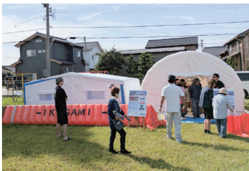
避難所用簡易パーテーション