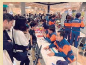
10月19日 こども消防フェスタ