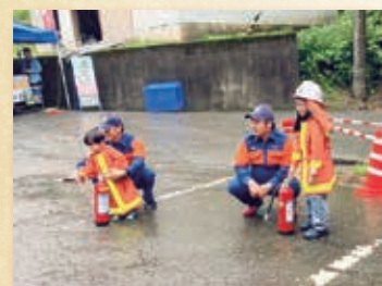
10月5日 大倉岳高原まつり

広報部会は、全分団から1名ずつ選抜された優秀な人材で構成されています。 様々なイベントに参加し、市民の皆様には消防団の活動を伝えています。