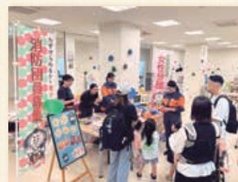
10月18日 小松大学 青松祭