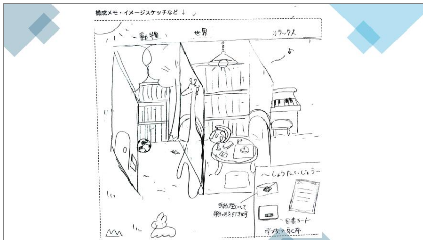
子ども図書館のイメージ