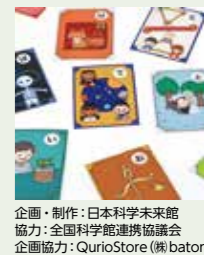
企画・制作: 日本科学未来館 協力: 全国科学館連携協議会 企画協力: QuirioStore(興baton)