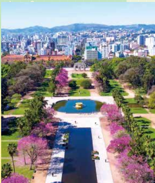
▲ポルト・アレグレ市の中心部にあるファホウプーリャ公園