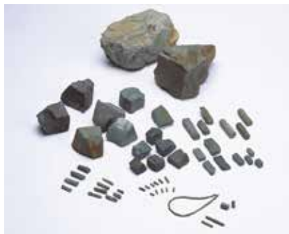
▲八日市地方遺跡出土 管玉製作工程資料

市が所蔵する2つの重要文化財を中心に「交流」「モノづくり」の視点から出土品を紹介します。