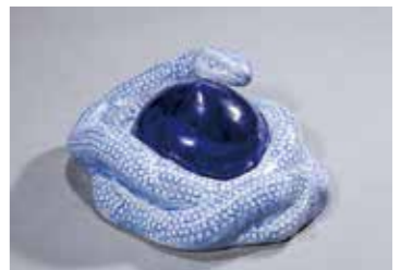
▲三代徳田八十吉「干支置物 巳」 今年の干支に関連する九谷焼なども展示しています。