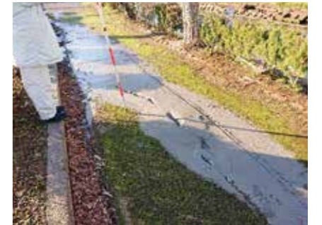
歩道の液状化状況(浜田町)