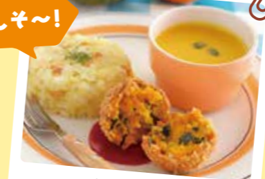
1月のメニューは 「かぼちゃコロッケ・カレーピラフ・かぼちゃのスープ」

住所 土居原町10-10 ☎58・1212 開館時間 10時~17時 ※12月28日(土)は13時閉館 休館日 月曜日(祝日の場合は翌日)、年末年始(12月29日~1月3日) 対象年齢 6カ月~小学6年生 ※保護者1人につき子供3人まで 入館料 90分:子供300円、大人200円(市外+100円)