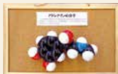
分子模型作り講座

とき 2月21日(金)13時30分～15時30分 定員 10人(先着順) 参加費 1,100円