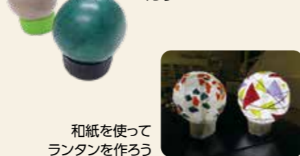
和紙を使ってランタンを作ろう