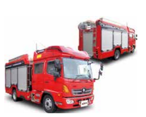
高機能消防ポンプ車を更新