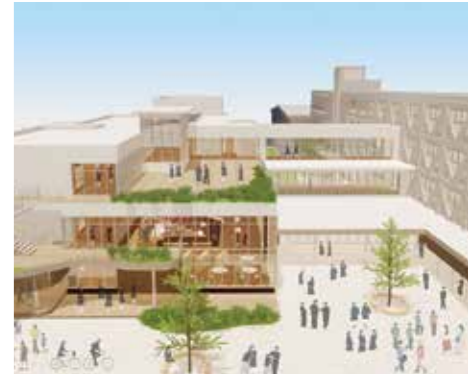
松陽中学校の設計・調査を実施 (画像はイメージ)