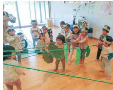
妊娠から出産・子育て・青年期まで、 切れ目のない手厚い子育てサポートを実施