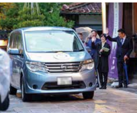
全国に先駆けて小松市ライドシェアを開始