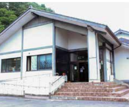
尾小屋鉱山の文化観光資源の価値を向上