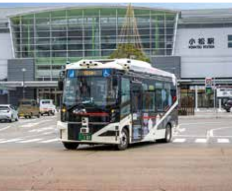
3月に通年運行を開始した自動運転バス