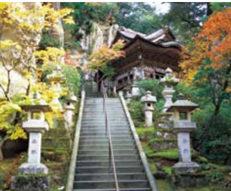
那谷寺遺跡の調査を実施し魅力アップへ