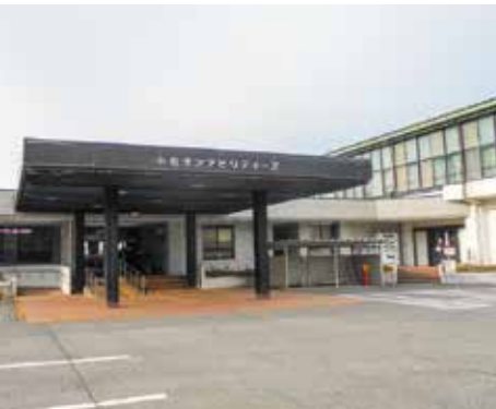
小松サン・アビリティーズを大規模改修