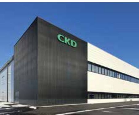
正蓮寺産業団地で CKD(株)北陸工場が操業開始