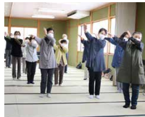
介護予防・認知症施策を拡充