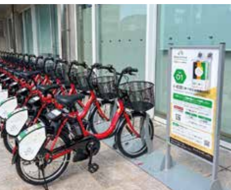
サイクルポート、自転車数を 拡充し利便性を向上