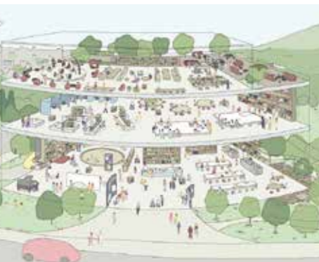
市民と共に創る未来型図書館 (未来予想図)