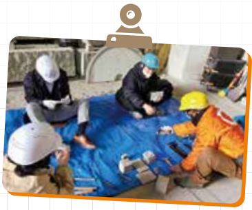
本格的なDIYを楽しめる。

小松市の「ものづくりの現場」をじっくり体験できるオープンファクトリーイベントです。多彩なプログラムを用意して皆さんをお待ちしています。