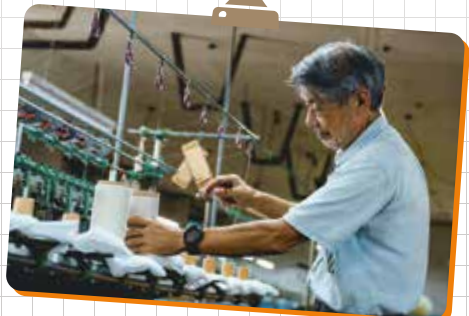
中間素材を作るサプライヤーや最終製品をつくる作家やメーカーの工場・工房見学