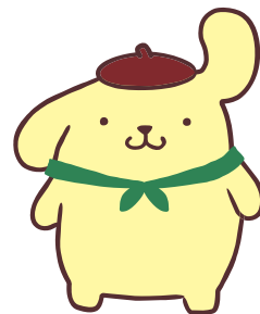
POMPOMPURIN © '23 SANRIO APPR.NO.L636493