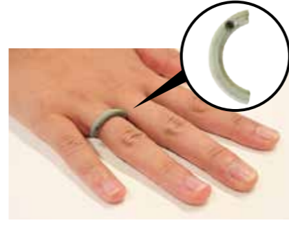
▲八日市地方遺跡出土石製指輪

◎2023新春無料公開展 とき 1月5日(木)～3月5日(日) 最新の遺跡発掘成果や、国の重要文化財の矢田野エジリ古墳出土埴輪などを公開します。 ※12月28日～1月4日は休館