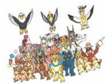
松元伸乃介さん作(部分)