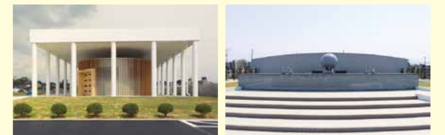
▲納骨堂(左)と合葬墓

両施設で納骨を開始します。納骨を希望する人は、事前に建築住宅課窓口で申請をお願いします。 ☎ 建築住宅課 ☎24・8159