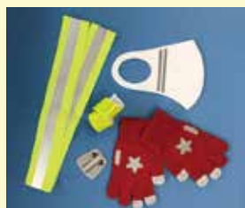
◀防寒や感染症対策を兼ねた反射材付きグッズ

自動車を運転する人は、早めにライトを点灯することが大切です。横断歩道は歩行者優先を徹底し、手前で早めに減速しましょう。また飲酒運転、あおり運転などは絶対にやめましょう。