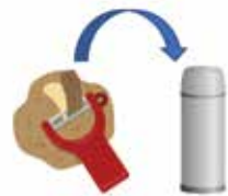
ジャガイモの皮でピカピカに!

最近マイボトルを持ち歩く人が増えています。水筒の茶渋の汚れにお困りではありませんか。ジャガイモの皮と、水を水筒に入れふたを閉め、1分程度上下に振ると、茶渋が落ちます。