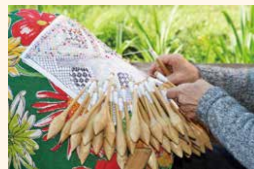
▲アゾレス諸島の伝統文化の一つ「ポピンレース」

ブラジルは色々な国からの移民たちが、それぞれの母国の文化を受け継いで暮らしています。私の出身地・フロリアノポリス市はアゾレス諸島(ポルトガル)の植民地だったので、伝統として伝わっている文化のほとんどはアゾレスのものです。ほかにもドイツやイタリアからの影響を受け、ドイツの有名なビール祭り「オクトパーフェスト」を毎年開催する市もあります。北東地方では、奴隷とされたアフリカ人が自分たちの文化を途絶えさせないように、先住民のインディオ族の文化と融合したアフリカ文化を創りましたが、それもブラジルの伝統文化と呼ぶことはできません。