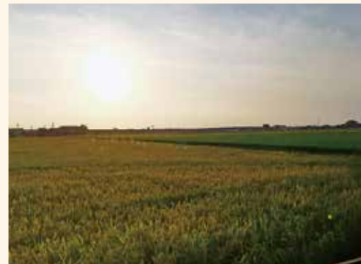
▲撮ったら「普通じゃないか」と言われたけど、田んぼのないシンガポール出身の私には、とても美しい。

人類学者は、なるべく現地に行き、地元の人たちと交流したり見学したりすることで、世界中の様々な文化を学びます。面白いことに、人類学者が発見することは地元の人でも気付いていないことがあります。なぜなら、当たり前のようになった習慣は外の目からは独特に見えるからで