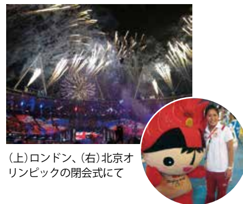
(上)ロンドン、(右)北京オリンピックの開会式にて