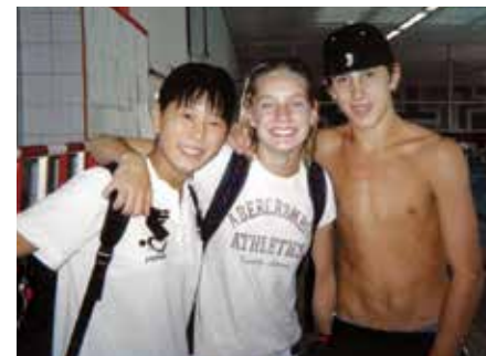
▲初めての海外遠征先(ドイツ)の様子

私が初めて日本代表として海外試合に出場したのは中学3年生の時。ドイツで行われた世界ジュニア選手権でした。その頃の私は好奇心旺盛でまだ怖いもの知らず。人生初の海外にも関わらず、新しい世界が切り開かれていくことにワクワクしていたことを覚えています。