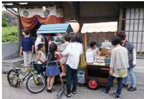
▲502(こまつ)まちカフェ隊

※小松市まちづくり市民財団(こまつまちづくり交流センター、義経アリー ナ)、小松市社会福祉協議会(第一コミセン)、南部行政サービスセンターでも 申請できます。