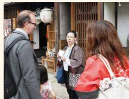
▲外国人を案内する通訳ボランティア

5月に開催される「お旅まつり」には毎年多くの外国人が訪れます。海外からのお客様に英語でお旅まつりの歴史や風習などを紹介し、小松市の魅力を伝えてみませんか。