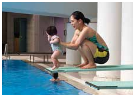
▲水遊びが大好きな娘。1mの高さを初体験！