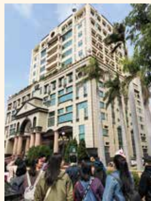
▲今回訪問予定の建國科技大學