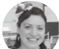
アリアナさん (コロンビア出身) 料理・文化紹介