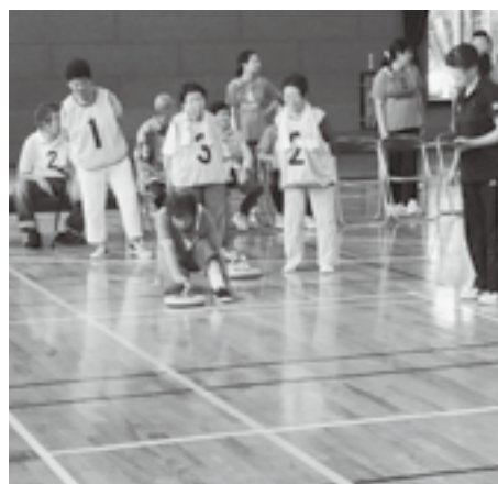
カローリング大会の様子 ※氷上で行うカーリングを基にした室内で気軽に行えるスポーツ。

体育施設にスロープやオストメイト、車椅子に対応したトイレなどを設置したり、みんなが使えるスポーツ器具を整備したりとバリアフリー化を進めています。また、障がい者スポーツの推進のため、指導者の養成や親子水泳教室、カローリング大会の開催などを行っています。