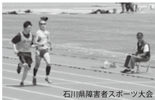
石川県障害者スポーツ大会