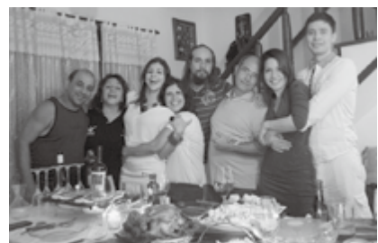
▲クリスマス・お正月はブラジルの定番料理が並びます。新年を迎える瞬間はみんなでハグし合います。

皆さんからのご意見や感想をお待ちしています。 国際都市推進課 ☎24・8039 kokusai@city.komatsu.lg.jp