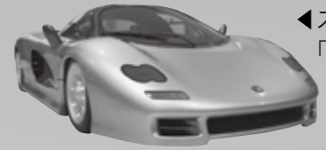
◀スーパーカー「JIOTT キャスピタ」

昨年、小松市移転20周年を迎えた日本自動車博物館。懐かしの車から世界に1台しかない幻の車まで、約500台が展示されています。