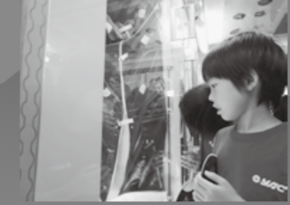
▲宇宙ステーションこまつ「ISS KAGAYAKI」見学