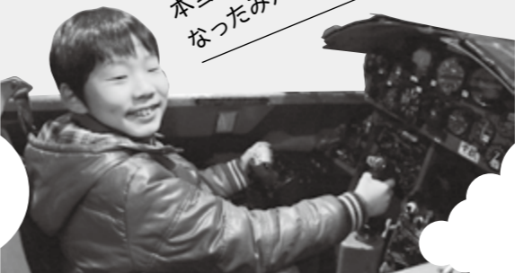
本当のパイロットになったみたいだ!

乗りものやものづくりの現場を見学しよう。 とき 3月22日(火)、23日(水)いずれも10時～15時30分 集合場所 市役所 ※バスで移動。 内容 ●22日(火) コマツ粟津工場、小松基地 ●23日(水) 小松協栄瓦企業組合、小松基地 対象 小学生以上 定員 各40人(応募多数の場合は抽選) 参加費 大人・高校生1500円、中学生以下800円(昼食付き) 申込期間 3月1日(火)～11日(金) 申し込み 富士トラベル 石川 ☎24・1131