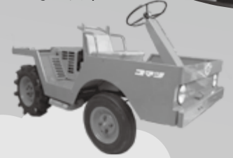
◀小松製作所が製造した農民車 コマツ(1960年製)

◆高所作業車乗車体験 高所作業車から見渡す景色を楽しもう。 とき 3月20日(日)、27日(日)いずれも10時～15時 ところ エボルエプラザ(中庭) 参加費 無料 ◆JAF子ども免許証ブース クイズに答えて子ども免許証をゲットしよう。 とき 3月20日(日)、27日(日)いずれも10時～15時 ところ わくわくホール 参加費 無料