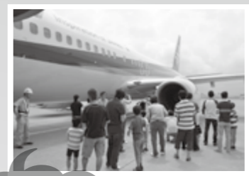
普段は見られない場所が見学できる!!