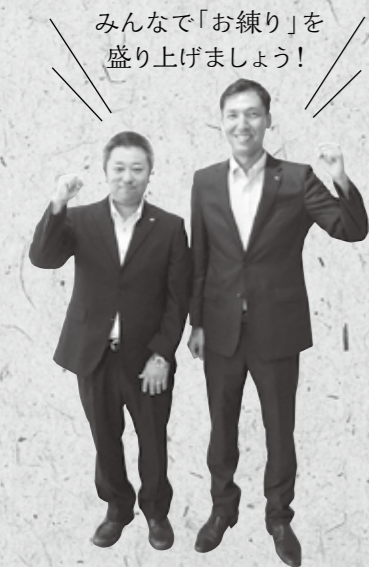
「勸進帳」小松特別公演実行委員会(公社)小松青年会議所の皆さん

10月13日(木) 午後1時~みよっさ前より 市民の皆さん、熱い声援でのお出迎えをお願いします。