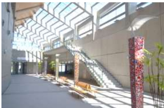
生涯学習センター