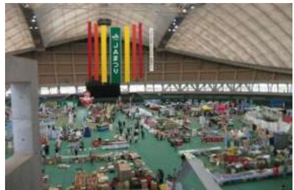
大規模催事の様子