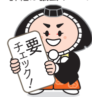
小松市イメージキャラクターカブッキー