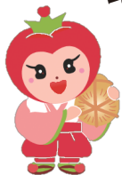
JA小松市イメージキャラクター こまとちゃん