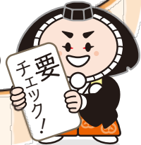
「小松市イメージキャラクター カブッキー」