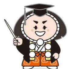
小松市イメージキャラクター カブッキー