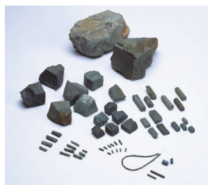
重要文化財 八日市地方遺跡出土品 管玉製作工程資料