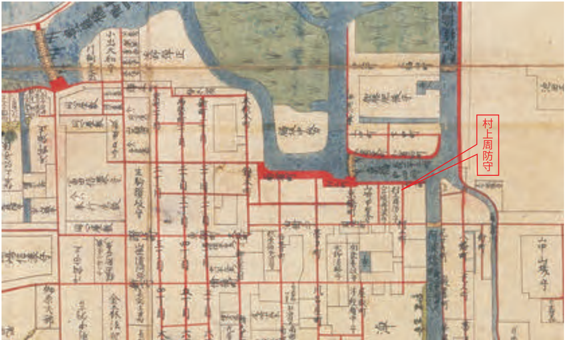
伏見古御城絵図(部分) (大工頭中井家所蔵建築指図)

城下の京橋付近に村上周防守邸が見える。近年、村上邸隣接の宮城丹波守に充てた村上頼勝の書状が、金戒光明寺(黒谷浄土宗)の塔頭永運院(京都市左京区黒谷町)の襖下張りから発見されている(京都市歴史資料館『叢書京都の史料9 大中院文書・永運院文書』)。