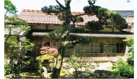
北前船模型(左)・「金剛」外観(右)