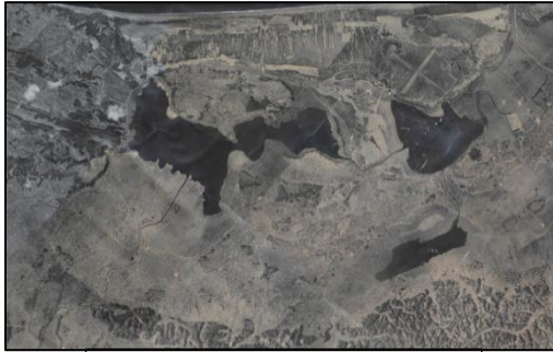
干拓前の加賀三湖 昭和22年