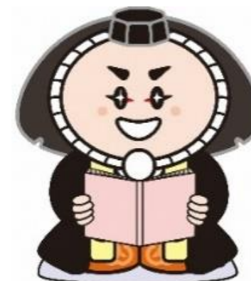
小松市イメージキャラクター カブッキー