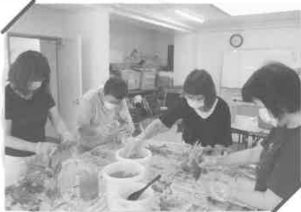
ガーデニング教室