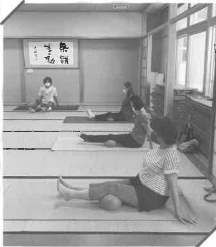
体幹リフレッシュ教室