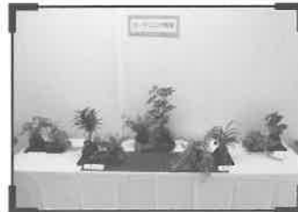
ガーデニング教室