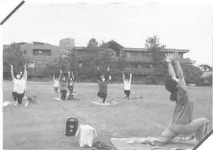
元気はつらつ体操教室