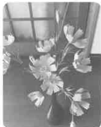
コスモス(牛乳パック)