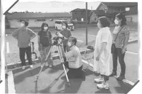
星空ウォッチング