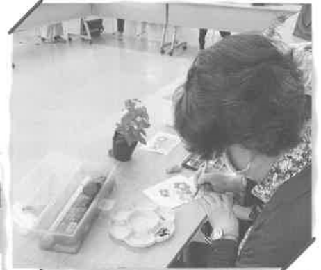
はがきサイズの楽しい水彩画教室