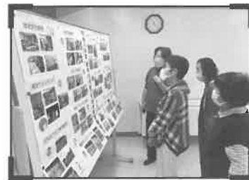
令和4年度の活動紹介