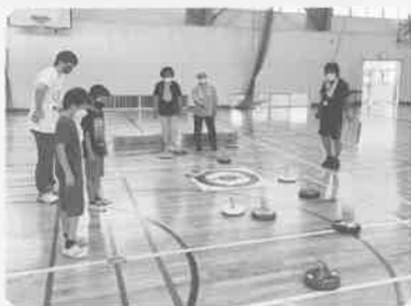
的に一番近いのは...