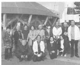
コスモアイル羽咋

そして青柏祭や奉燈祭など能登を代表する祭り体験もあり、能登の祭りの熱気と情熱に触れた一日でした。