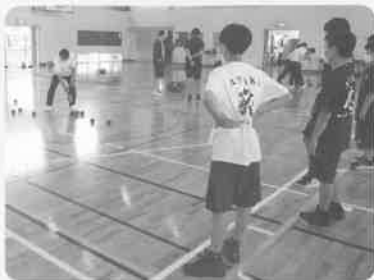
点数を確認!判定は?