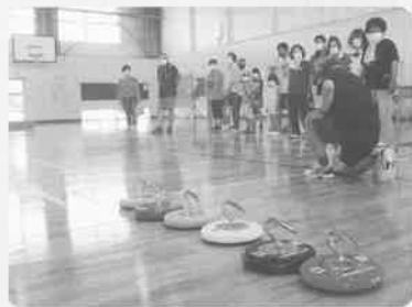
集中...狙いを定めて