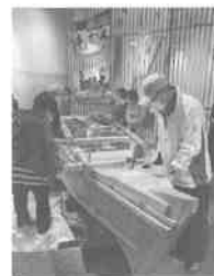
のと里山里海ミュージアム