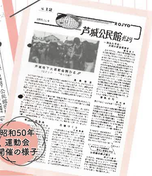
昭和50年 運動会 開催の様子

昭和28年 第1回芦城校下大運動会開催 S29年2月 芦城青年会が結成大会開催 S29年4月 大和善隣館にて芦城公民館が開館 S33年 公民館報第1号創刊 芦城「高砂会」結成