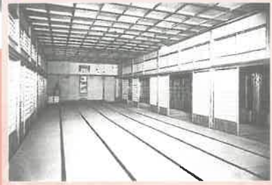
芦城小学校倫武館に移転 (のち集義堂と呼ばれる)