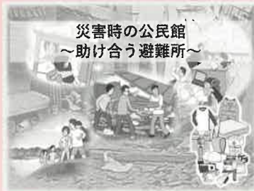
災害時の公民館～助け合う避難所～

ぜひ各町内や公民館、ご家族の間でもお話し合いの機会を作って防災意識を高めていきましょう。