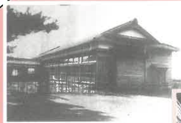
倫武館大広場 (芦城小学校創立 二百年記念誌より)

S50年 第1回老人と孫の運動会開催 S47年 第1回慶人式(65才)開催 S50年 「あしろ学級(高齢者学級)」発足 県の優良公民館として表彰される