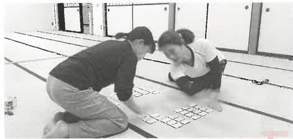
年末に教室にきてくれました(練習風景) 札を取るスピードが早い!!!

今でも恩師の先生方をはじめ、小松かるた会の熱い応援があったからこそ、クイーンにまでなることができました。この小松かるた会から再び名人クイーンがでることを楽しみにしています。