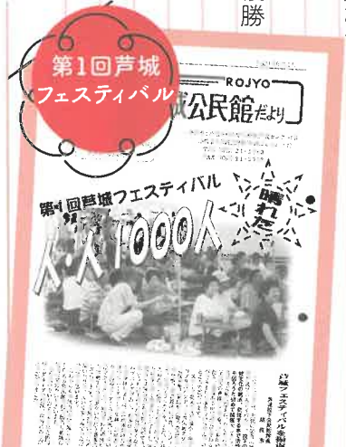
第1回芦城フェスティバル

H10年 芦城を知る教室、料理の達人教室、音楽の集い教室(のち女性合唱教室)など5教室開講 H14年 女性合唱教室が合唱教室ひまわりになる。お父さんの井戸端教室開講 H14年8月 第1回芦城フェスティバル開催