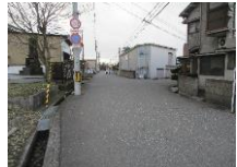
⑲ コマツ栗津工場横～松生町コミュニティセンターへの道

白線が消えている。幅員が狭い上に、符津町の大企業への抜け道として通行する車がスピードをあげて通行するのでとても危険である。