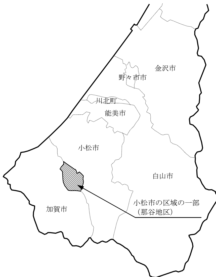
地図A 地域再生計画の区域に含まれる行政区画を表示した図面