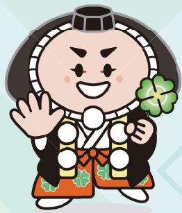
小松市イメージキャラクター カブッキー