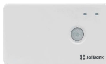
人感センサー 熱中症リスクの感知

協力員の連絡先を事前登録できますが、利用者から協力員への発信（5分以上）は有料です。ただし、コールセンターへの通報、協力員が発信した場合の通話は無料です。小松市内に限り、通報時の位置情報が発信されます。