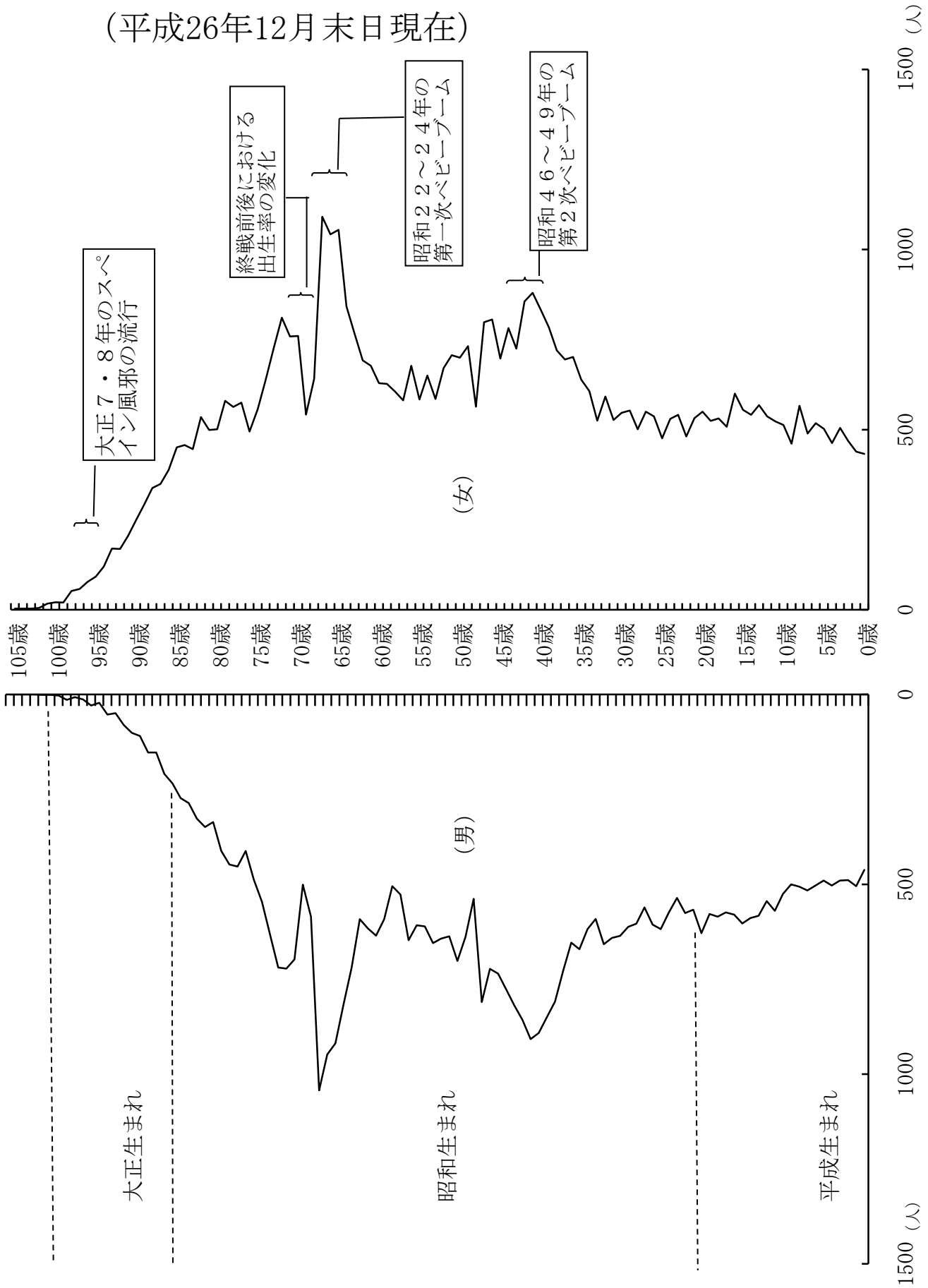
第8-1図 人口ピラミッドの変化 (平成26年12月末日現在)