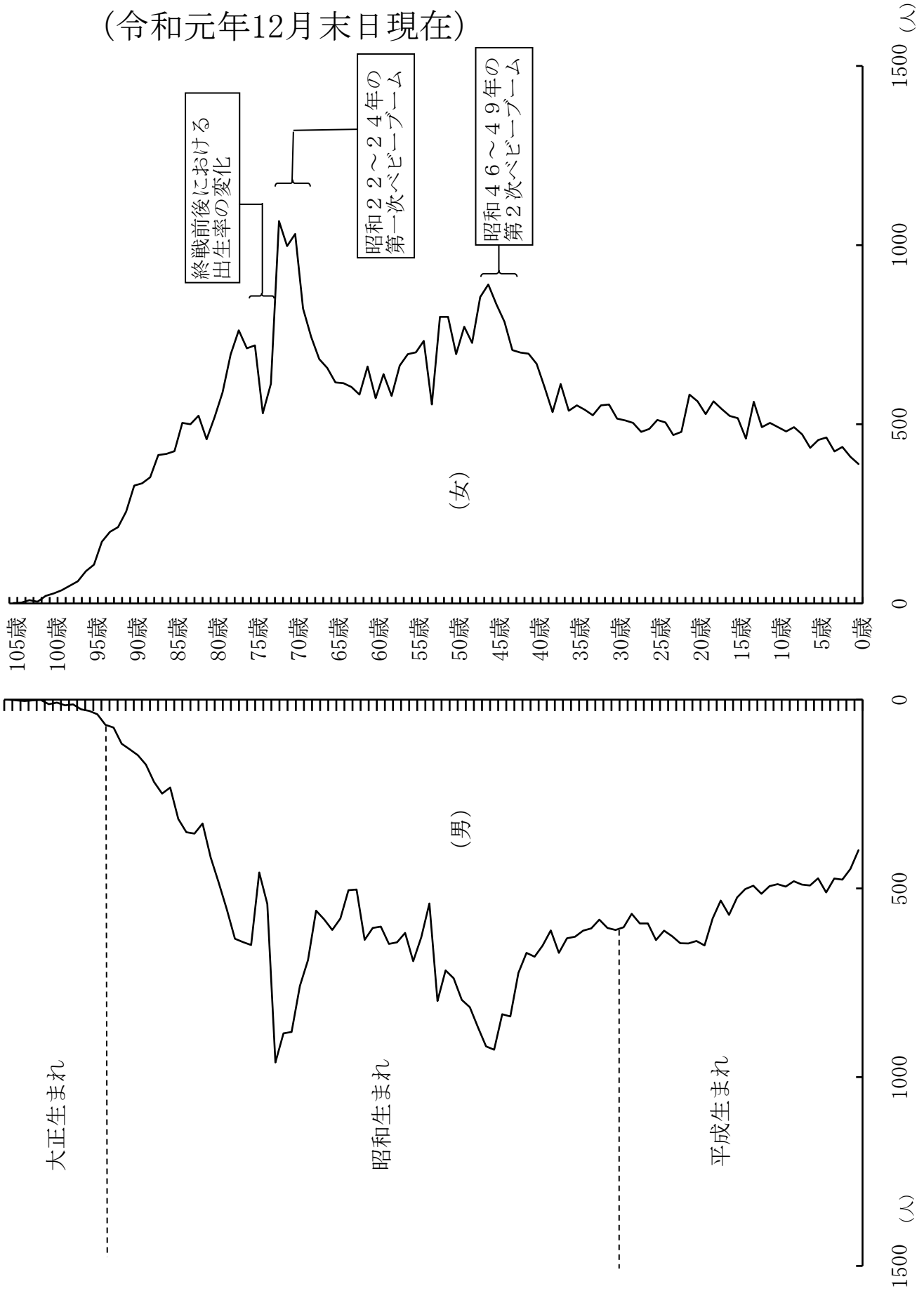
第8-1図 人口ピラミッドの変化 (令和元年12月末日現在)