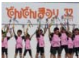
Apresentação no Festival de 2007