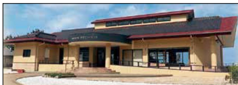
Fachada do Ataka View Terrace

Café e restaurante. Também na região entre a praia e o templo, fica o Ataka View Terrace, um café descontraído e todo envidraçado, que permite ampla vista para o mar. Aqui, o visitante pode saborear pratos rápidos feitos com ingredientes frescos, pescados localmente. O café fica aberto das 9:00 às 17:00, fechando às quartas-feiras.