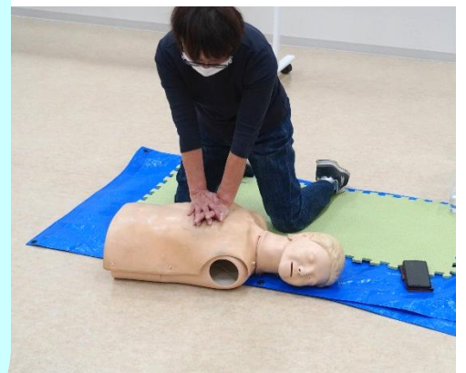
心臓マッサージ体験