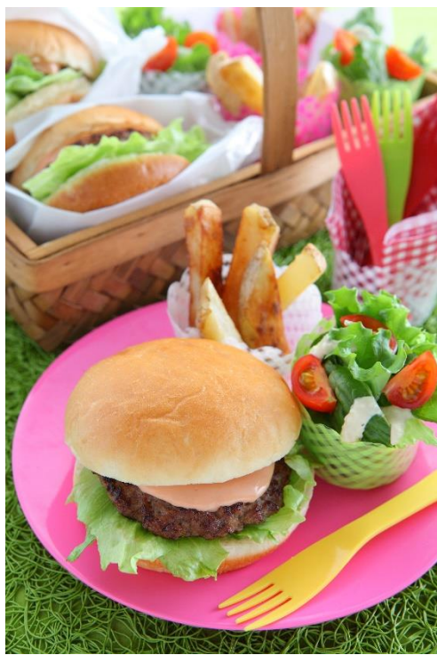
体験メニュー（イメージ）