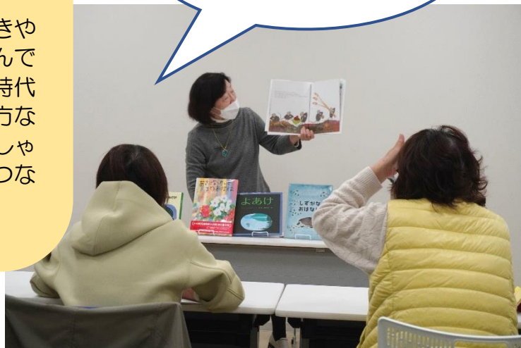
絵本の読み聞かせ