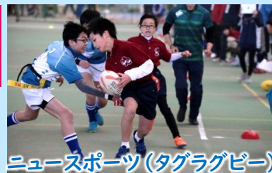
ニュースポーツ(タグラグビー)