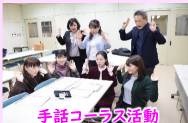
手話コーラス活動